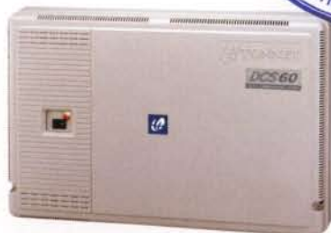
DCS-60 (52 ports)