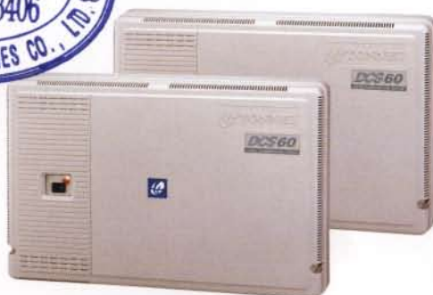
DCS-60M3 (108 ports)