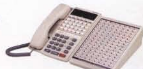
TD-8613/5D / TA-8633