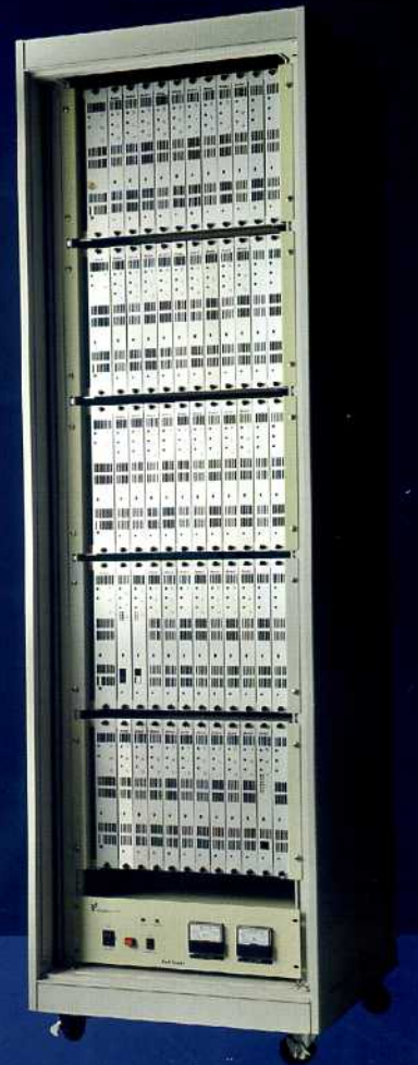
IBS800系統 DC48V 充電機(10A-50A)